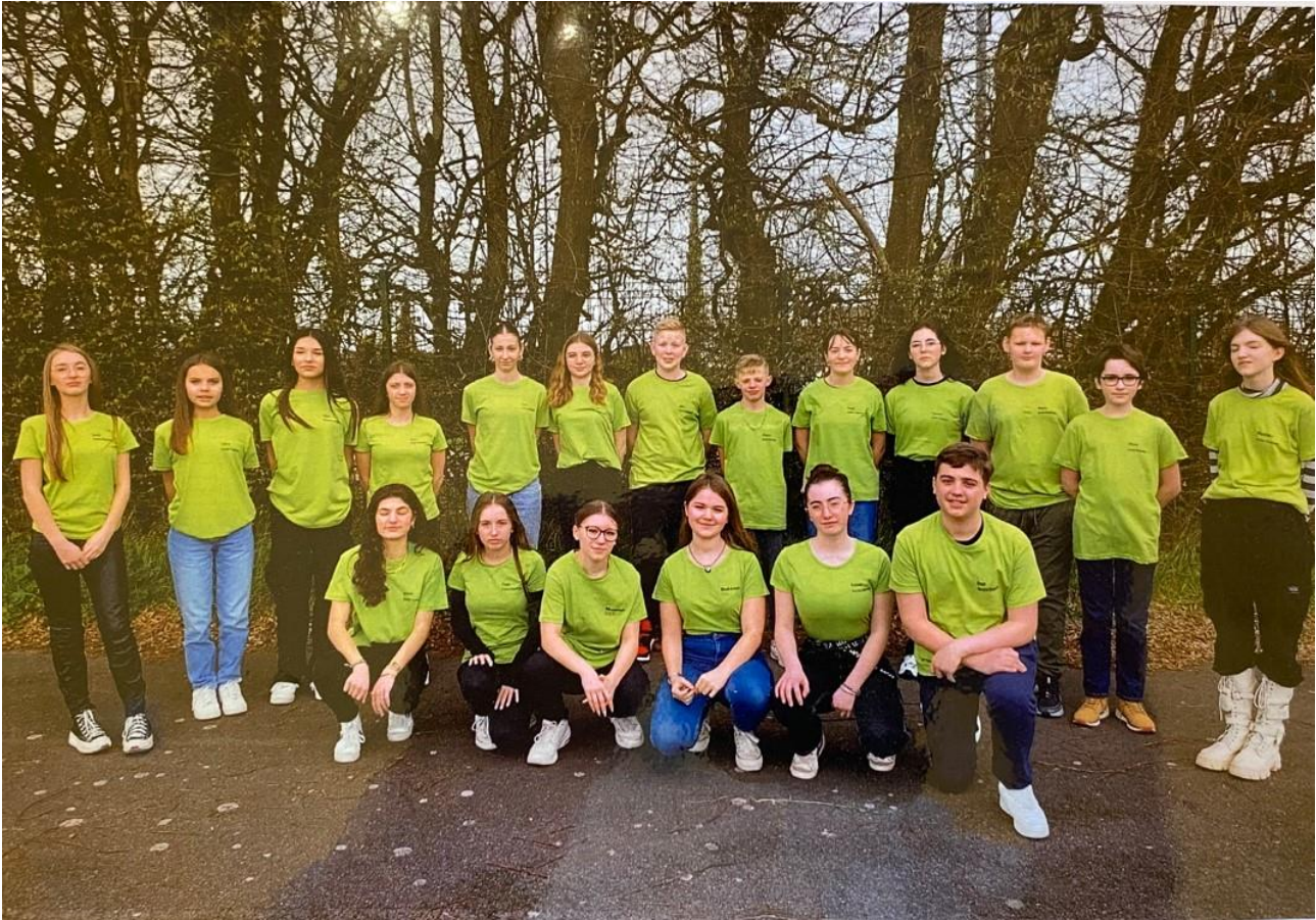
LES ELEVES DE LA MINI ENTREPRISE